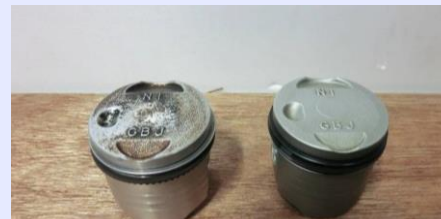
エンジンピストンの 焼き付き