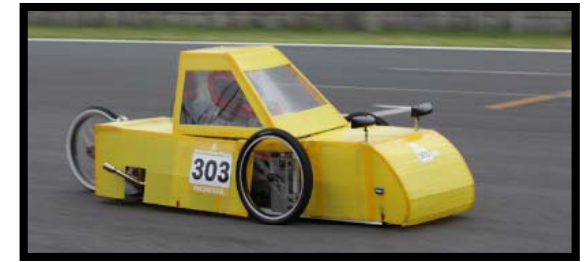
もてぎ大会での疾走！！！！

Honda エコマイルレッジチャレンジ Honda Eco Mileage Challenge