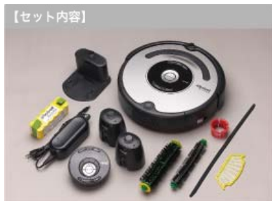
掃除ロボットルンバ