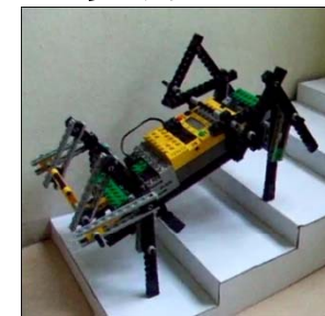
上4枚:階段昇降ロボット  1/1