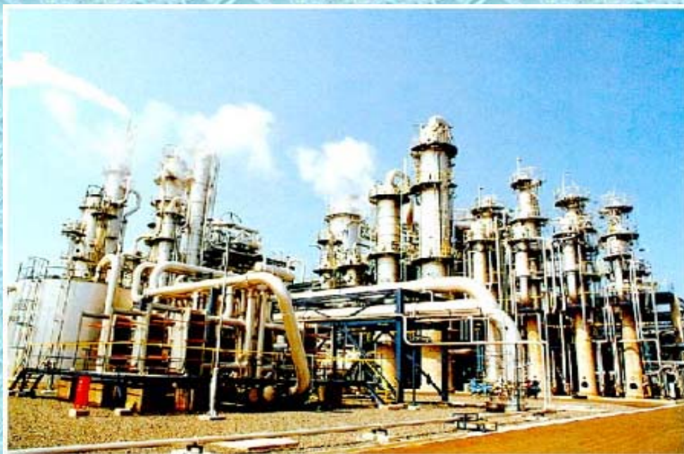
大型化学プラント